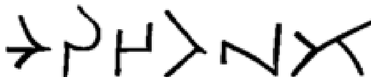
Şəkil 3. Xəzərlərə məxsus run yazısı

İlk orta əsr yaşayış yeri Qaramanlı kəndi kurqanı Qaramanlı kəndi İlk orta əsrlər